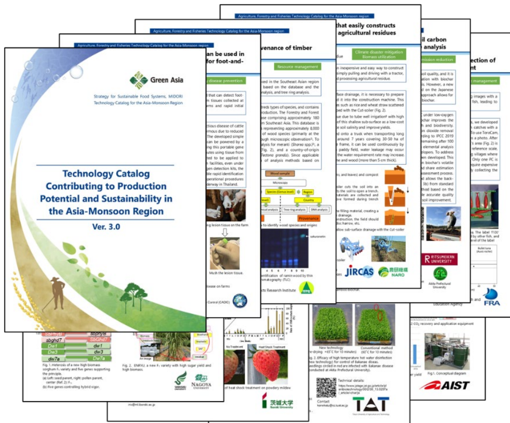
技術カタログ Ver.3.0 の表紙および内容